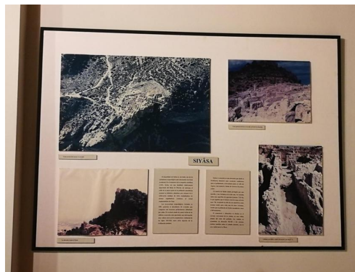
Figura 5. Cambio del diseño de este panel, pero manteniendo el contenido sobre el yacimiento de Siyâsa