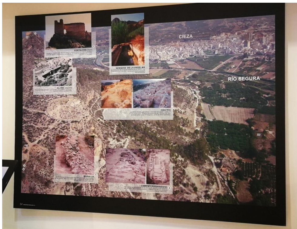
Figura 2. Propuesta de nueva panelería informativa

La panelería o cartelería informativa que hay en el Museo de Siyâsa actualmente recoge diferentes elementos bajo una forma visual, por lo que se pretende mantener el contenido, pero modificando el diseño de los mismos bajo un fondo negro. Se pretende continuar la línea museográfica que comenzó hace unos años con la colocación de unos carteles, dando uniformidad al museo junto con una imagen corporativa añadida.