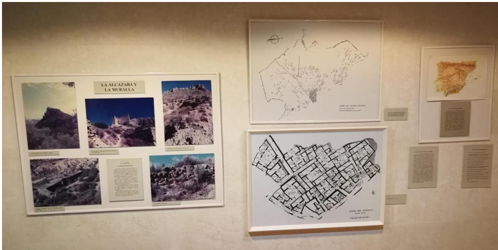
Figura 6. Estos planos y paneles se unificarían en un solo cartel, ofreciendo una imagen más unificada y actualizada.