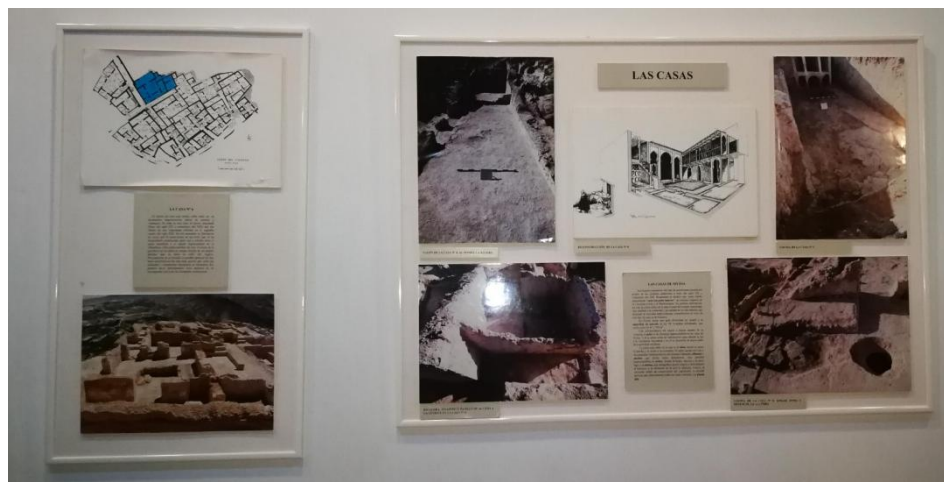
Figura 4. Panelería de acceso a la casa 6. Estos paneles se harían con fondo negro, uno de ellos hablando de forma general de las casas de Siyâsa y el otro hablaría sobre la casa 6.