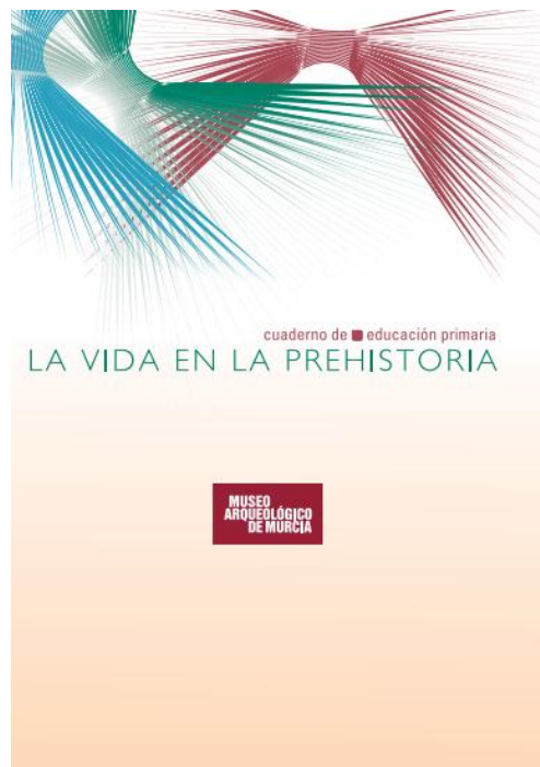
Figura 10. Ejemplo de cuadernillo didáctico

El contenido de cada uno de los cuadernillos deberá ser aceptado por la Concejalía de Museos del Ayuntamiento de Cieza.