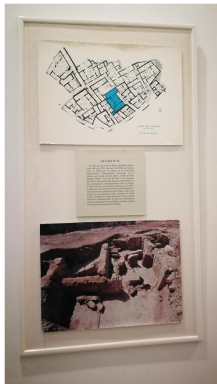
Figura 7. Cartel de acceso a la casa número 10

Toda la cartelería antes de ser impresa y colocada en el museo, deberá ser supervisada por la Concejalía de Museos del Ayuntamiento de Cieza.