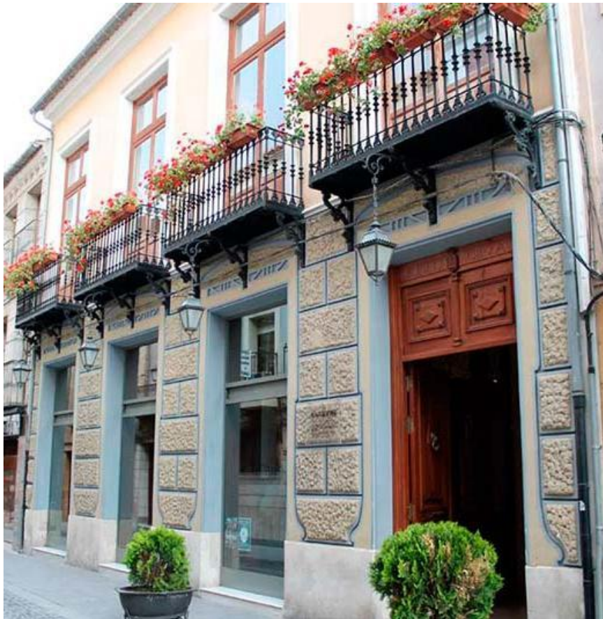
Figura 1. Fachada del Museo de Siyâsa

El Museo de Siyâsa es un referente del patrimonio cultural y arqueológico en el ámbito nacional e internacional, que desde su inauguración en el año 1999 ha recibido numerosos visitantes que disfrutan de toda la riqueza arqueológica que alberga el municipio de Cieza. La principal peculiaridad del Museo de Siyâsa es la reproducción a escala real de la casa 6 y 10 del yacimiento Hisn Siyâsa. (GARCÍA BAÑO Y GUERAO LÓPEZ: 2015).