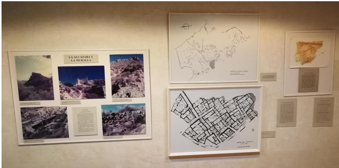
Figura 6. Estos planos y paneles se unificarían en un solo cartel, ofreciendo una imagen más unificada y actualizada