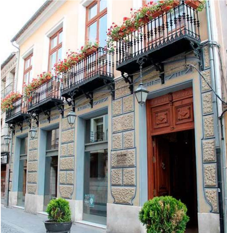
Figura 1. Fachada del Museo de Siyâsa

El Museo de Siyâsa es un referente del patrimonio cultural y arqueológico en el ámbito nacional e internacional, que desde su inauguración en el año 1999 ha recibido numerosos visitantes que disfrutaron de toda la riqueza arqueológica que alberga el municipio de Cieza. La principal peculiaridad del Museo de Siyâsa es la reproducción a escala real de la casa 6 y 10 del yacimiento Hisn Siyâsa. (GARCÍA BAÑO Y GUERAO LÓPEZ: 2015).