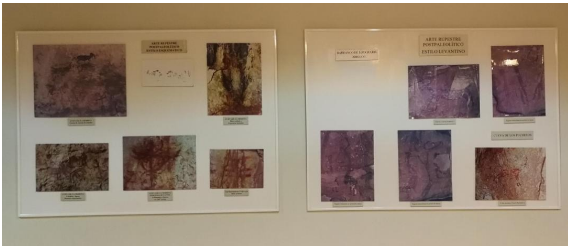
Figura 3. Paneles ubicados en la sala de prehistoria (Nivel 2). Se unificarían mostrando los estilos de arte rupestre del municipio de Cieza

A continuación vamos a mostrar algunos de los carteles que se modificarían, se cambiaría su diseño, pero no su ubicación ni su contenido. La cartelería debe mejorarse añadiendo fotografías de mejor calidad y haciéndolos más llamativos para todo tipo de públicos.