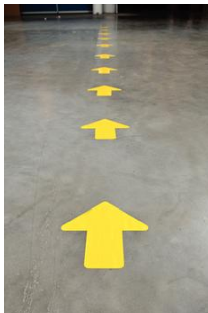
Figura 9. Ejemplo para indicar el recorrido por la sala del Museo de Siyâsa