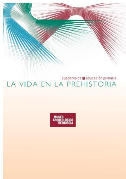
Figura 10. Ejemplo de cuadernillo didáctico

El contenido del cuaderno deberá ser aceptado por la Concejalía de Museos del Ayuntamiento de Cieza.