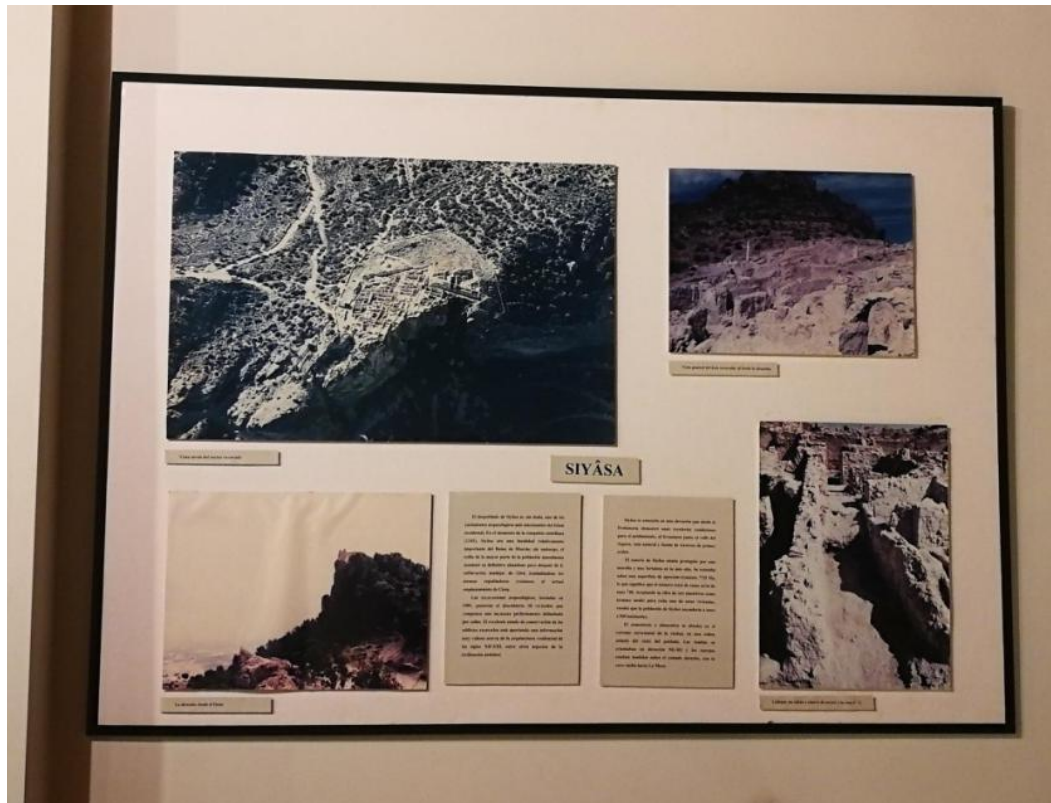
Figura 5. Cambio del diseño de este panel, pero manteniendo el contenido sobre el yacimiento de Siyâsa