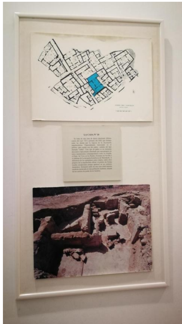
Figura 7. Cartel de acceso a la casa número 10