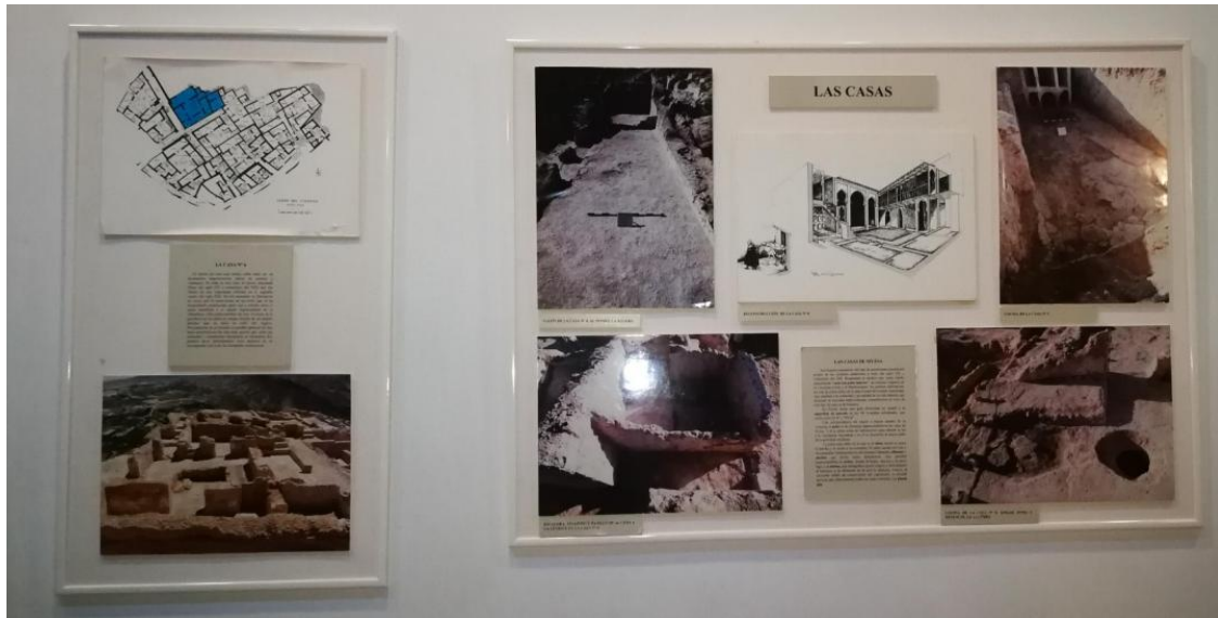
Figura 4. Panelería de acceso a la casa 6. Estos paneles informarían de forma general sobre las casas de Siyâsa y en concreto sobre la casa 6