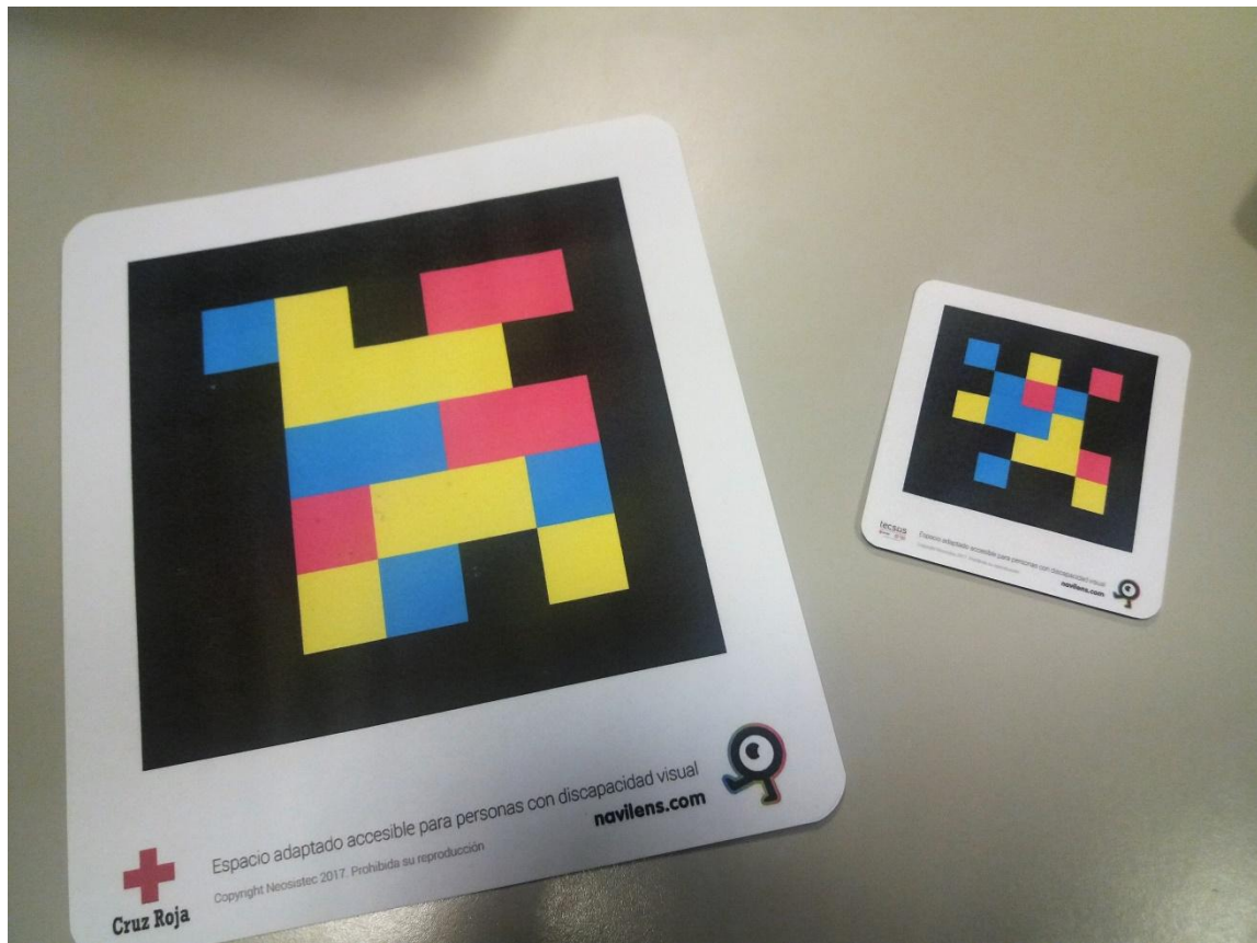
Figura 11. Ejemplo de código QR

Es importante remarcar que la aplicación es capaz de funcionar sin conexión a internet al disponer de memoria, siempre y cuando la utilicemos para reconocer etiquetas que ya hubiésemos identificado previamente con conexión.